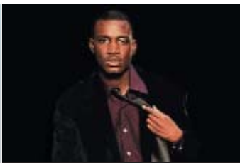
Abd Al Malik